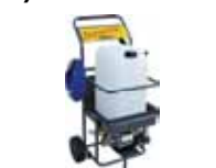
KIT DESINFECCIÓN MANUAL