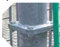
KIT ARCO DESINFECCIÓN ARCA detalle de la conexión entre las columnas