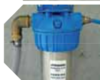
KIT MÓDULO BOMBEANTE detalle del filtro entrada agua

20 bar, 21 l/min. Módulo con base de acero cincado y cubierta en acero inox, completo de: • motor eléctrico de 3x400V-1450 Rpm, • Bomba a.p. 150 bar, 21 l/min, con cingüeñal, 3 pistones de cerámica y culata en latón. • Válvula de regulación. • Válvula de seguridad. • Manómetro. • kit filtro de 20" y 10 mesh. • Fococélulas para el funcionamiento automático. • Indicador intermitente de funcionamiento. • Dispositivo ON-OFF de mando manual con kit antigoteo.