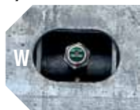
KIT DESINFECCIÓN RUEDAS detalle de la boquilla nebulizadora