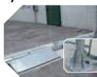
KIT TARIMAS detalle del basamento del arco de desinfección