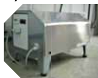
KIT MÓDULO BOMBEANTE