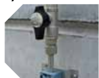
KIT DE CONEXIÓN detalle de la válvula de intercepción línea