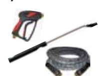
KIT PARA EL LAVADO DE VEHÍCULOS