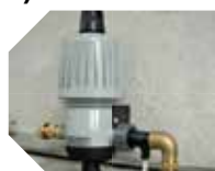
KIT DOSIFICACIÓN DESINFECTANTE detalle de la bomba dosificadora